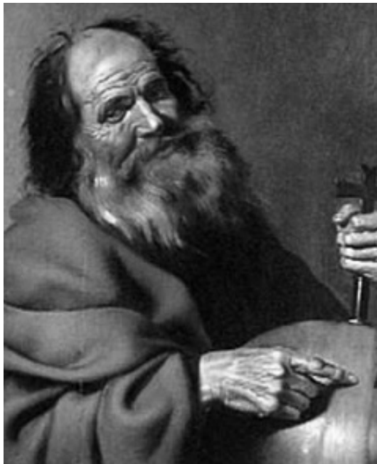
Figura 1.4 Demócrito de Abdera.

FICHÁRIO: Pré-socráticos; antes do século V a.C – período arcaico; Mileto, Éfeso, Colofão, Eléia, Samos, Crotona, Tarento, Abdera, Agrigento, Clazômenas – Ilhas Gregas; Corrente Filosófica: Idealismo, Materialismo